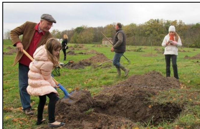
Ici, Le verger social où un arbre = une famille