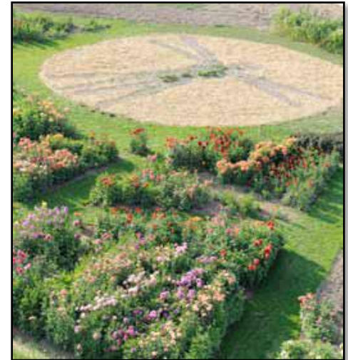
Collection de plantes médicinales en forme d' « homme de vitruve », au centre du Dhaliacolor composé de plus de 180 variétés de Dhalias.